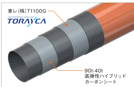
※ TORAYCA®は東レ㈱の登録商標です

世界初採用の90t-40t 高弾性ハイブリッドカーボンシートが方向の安定性を生み出し、航空宇宙用途に開発された強度と弾性に優れた東レ(株)の炭素繊維T1100Gが挙動を安定化。より精密な剛性設計を可能とし、軽量化と低トルク化の両立を実現しました。