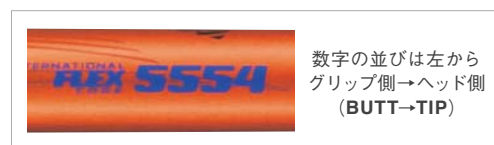
数字の並びは左からグリップ側→ヘッド側 (BUTT→TIP)